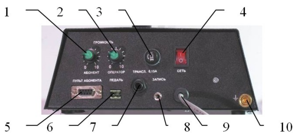
Рисунок 1.2 – Задняя стенка консоли оператора “Мост-дуплекс”

На задней стенке консоли оператора (см. рис. 1.2) расположены: