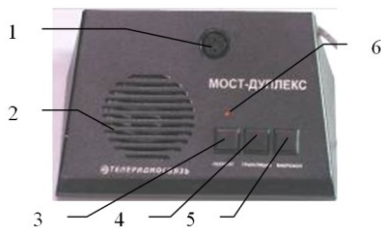
Рисунок 1.1 – Лицевая панель консоли оператора “Мост-дуплекс”

Пульт оператора “Мост-дуплекс” имеет консольную конструкцию в металлическом корпусе, лицевая панель которого изображены на рисунке 1.1,