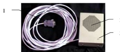
Рисунок 1.4 – Вид пульта абонента «Мост-дуплекс»

Пульт абонента (рисунок 1.4) регулировок не имеет.