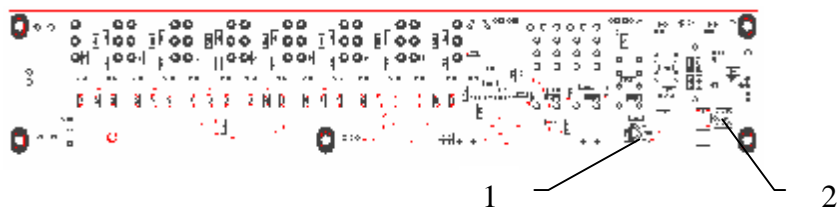
Рисунок 1.3 – Элементы настройки БСТЛ

где 1 – регулировка уровня сигнала с линии;